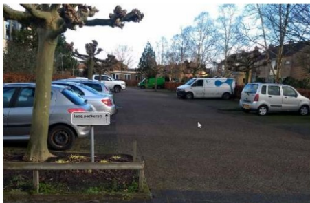
40 parkeerplaatsen aan de achterzijde