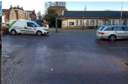
6 parkeerplaatsen aan de voorzijde